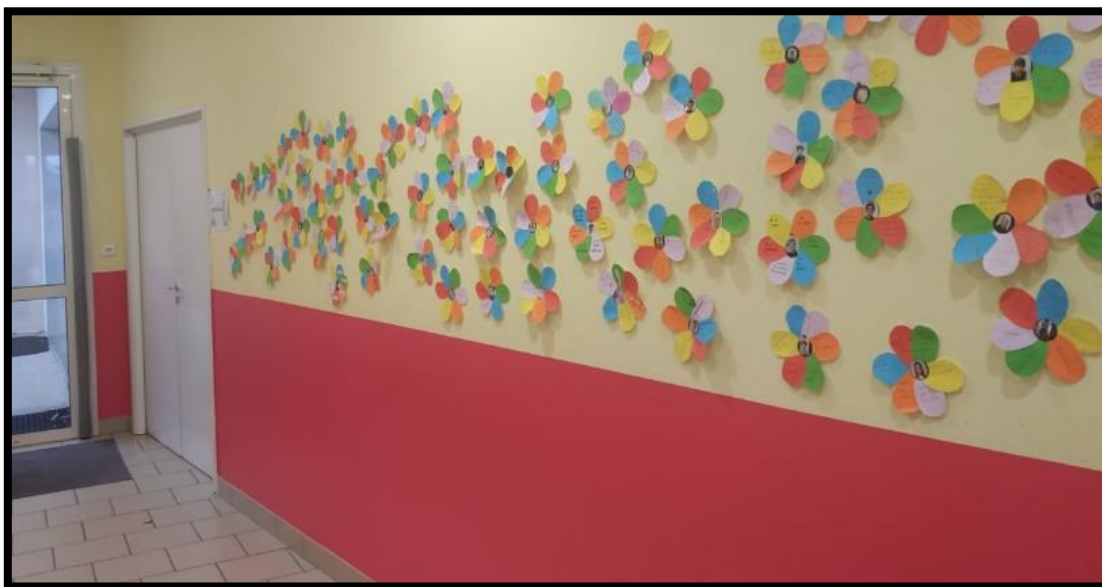
Ici, le mur d'entrée de l'école de Château Thébaud.

Ainsi, on réalise un véritable champ de forces qui place chacun dans une dynamique positive dès l'entrée dans l'établissement !