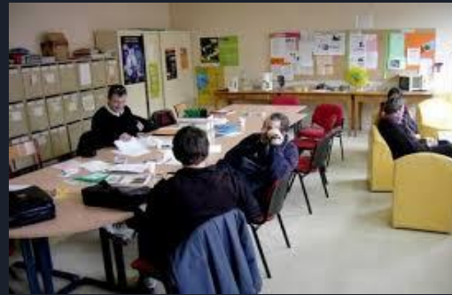
LA SALLE DES PROFS