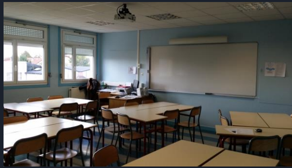
LA SALLE DE CLASSE