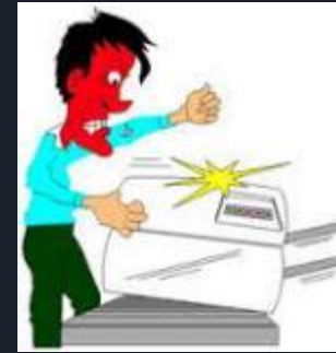
LA REPRO /CODE PHOTOCOPIEUR