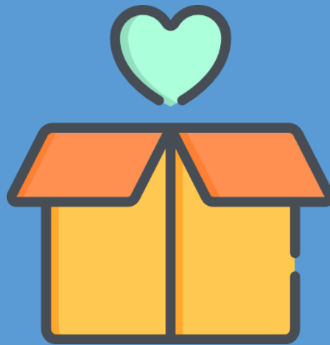
ILLUSTRATION POUR LA BOITE A GENTILLESSES