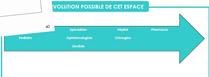
Dossier « Apprentissages dans les espaces Jeux d'imitation »